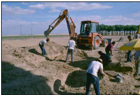
Control movimiento de tierra, ZONA 1

Durante todo el informe haremos referencia a la primera y única que pudimos excavar hasta el momento. El movimiento de tierras dirigido a la búsqueda de la segunda fosa, aún contando con una gran dedicación, dio resultados negativos.