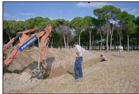
Control movimiento de tierra, ZONA 2

La fosa encontrada se localiza paralela a un pinar del que dista 5 metros y perpendicular a la carretera distando 32,10 metros, esta proximidad a la carretera es un dato que se repite en las fosas de este tipo, en esta ocasión los testimonios orales apuntan que los asesinaron en el pinar y los "ocultaron" en la tierra de labranza más cercana.