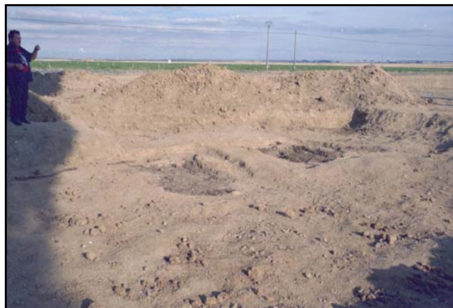
Fosas de la ZONA 1 con la excavación finalizada

Nuestra actividad en Bercial de Zapardiel no ha finalizado, ya que quedan por hallar las fosas de la zona 2 y zona 3, el empeño de este equipo es seguir adelante hasta encontrar los 9 cuerpos restantes.